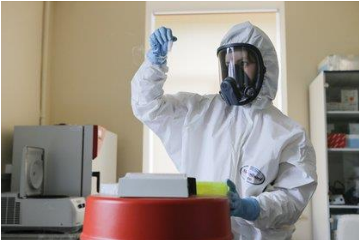
Una investigadora trabajando en el laboratorio de la vacuna rusa contra el coronavirus Sputnik V

Alberto Fernández cerró el hilo de tuits con entusiasmo pero remarcó cierta prudencia en la continuidad de protocolos y medidas de prevención hasta que efectivamente no lleguen las millones de dosis a la Argentina. “Estamos con muy buenas expectativas y muy esperanzados de poder una vacuna este año. Pero hasta entonces debemos continuar con las medidas de prevención y los cuidados pertinentes”, concluyó el Presidente.