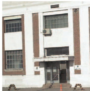
Edificio zona Puerto Sur Gerencia de Ingenieria Edificio 3