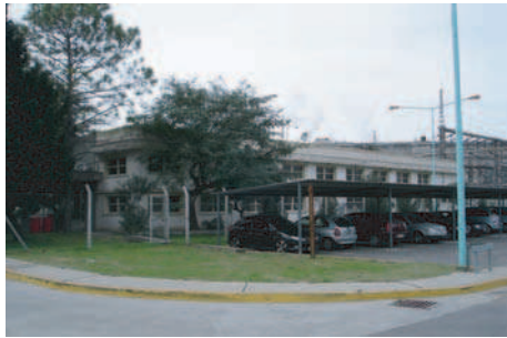
Gerencia de Seguridad Edificio 2