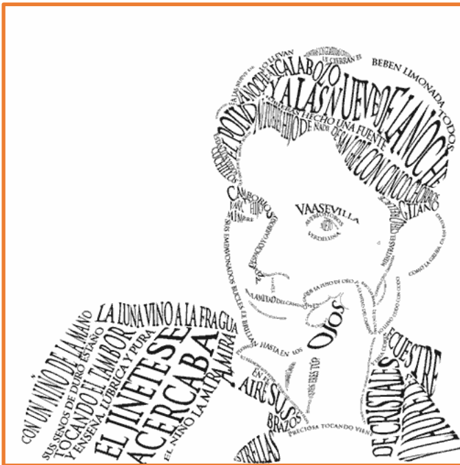
Retrato caligráfico de García Lorca por Juan Osborne

Se le llama caligrama al dibujo en el que la disposición del texto tipográfico, generalmente poético, crea figuras o escenas que hacen alusión al propio tema. A menudo se realizan caligramas utilizando textos que conforman los retratos de sus autores y autoras.