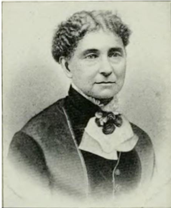
Susan B. Anthony (1820-1906)

Susan B. Anthony es un nombre que ha pasado a la historia por ser la líder del movimiento sufragista norteamericano , que reivindicó el derecho al sufragio femenino en la segunda mitad del siglo XIX. Junto a Elizabeth Cady Stanton, creó múltiples campañas en favor de la igualdad de los derechos de las mujeres.