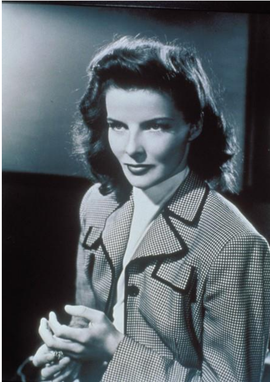
Simone de Beauvoir (1908-1986)

Filósofa y escritora francesa, Simone de Beauvoir fue una luchadora contra el sistema patriarcal, especialmente tras la publicación de su libro El segundo sexo , en 1949,