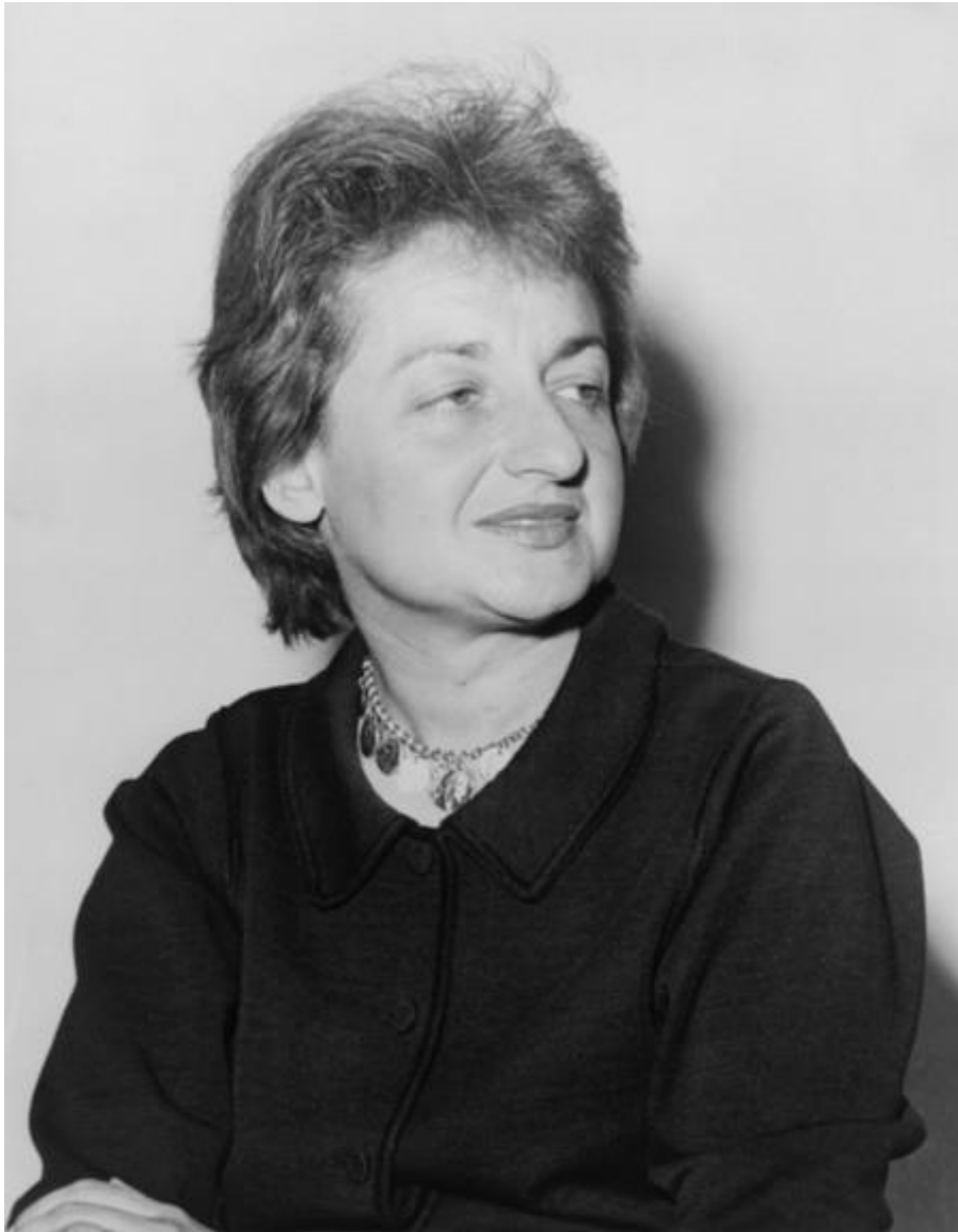
Margaret Thatcher (1925-2013)

La historia de la mujer tiene curiosos recovecos. Como el hecho de que una mujer que un día declaró que «odio el feminismo. Es un veneno» forme parte de la lista de mujeres que más han cambiado los movimientos femeninos. Ser la primera ministra del Reino