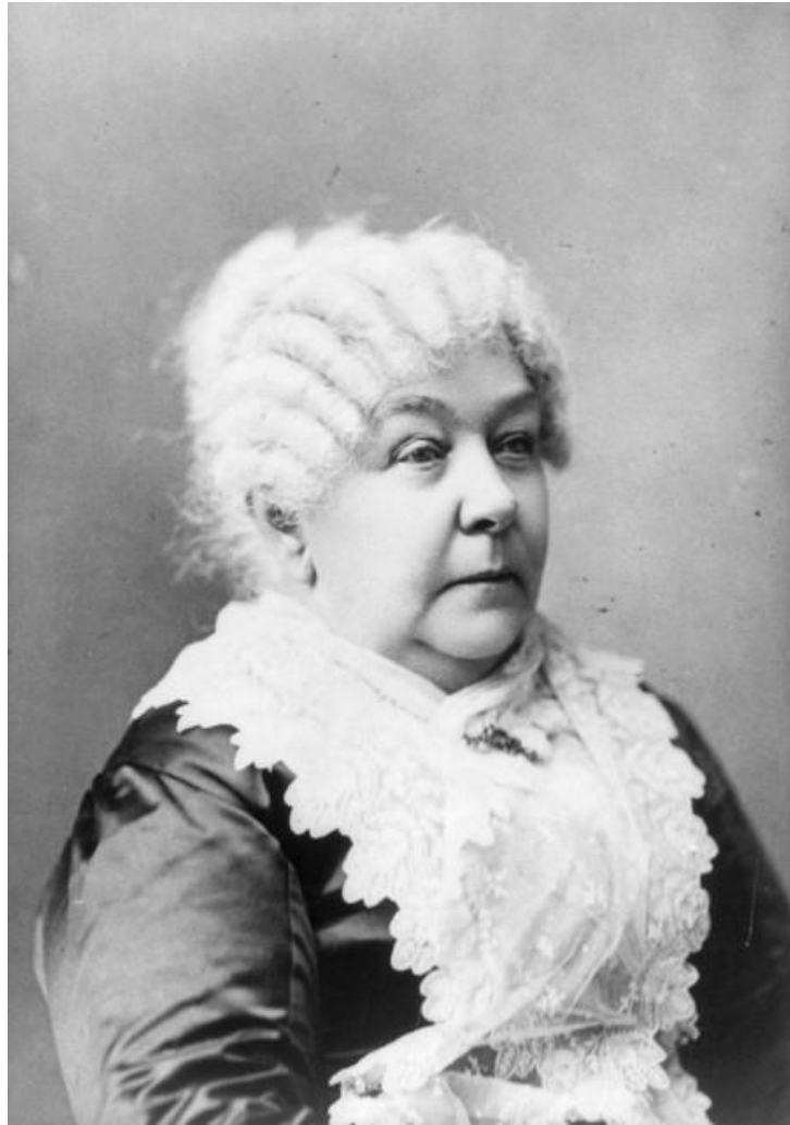
Lucy Stone (1818-1893)

En la persona de Lucy Stone confluyen la lucha privada y la pública: conocida feminista y abolicionista, decidió además mantener su apellido de soltera, como símbolo de su individualidad, lo cual generó mucha controversia en su época. Fue fundadora de la Asociación Americana por el Sufragio, la primera Convención Nacional por los Derechos de las Mujeres y Woman's Journal , la primera gran publicación feminista.