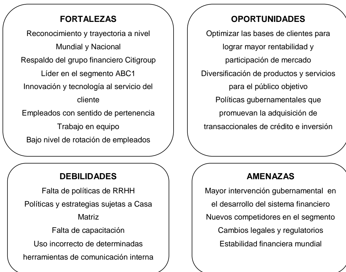
Figura 4: Matriz F.O.D.A. de Citibank Argentina. Fuente: Elaboración Propia. (2013)

En el siguiente cuadro se puede apreciar las fortalezas y debilidades que surgen de la evaluación interna de la compañía, y también el resultado del análisis externo en cuanto a oportunidades y amenazas.