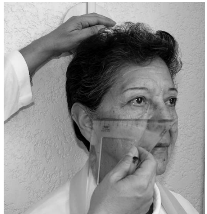
FIGURA 3 Fotografía de la técnica de medición de la estatura verificando el Plano de Frankfort

La línea imaginaria que va desde el agujero infraorbitario al conducto auditivo externo, paralela al piso y con la vista al frente, lo que permite tomar la medición correcta.